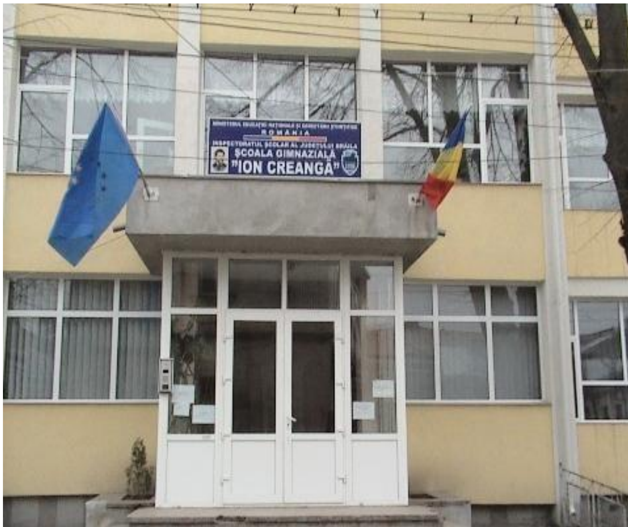
STRADA ȘCOLILOR, NR.15, BRĂILA